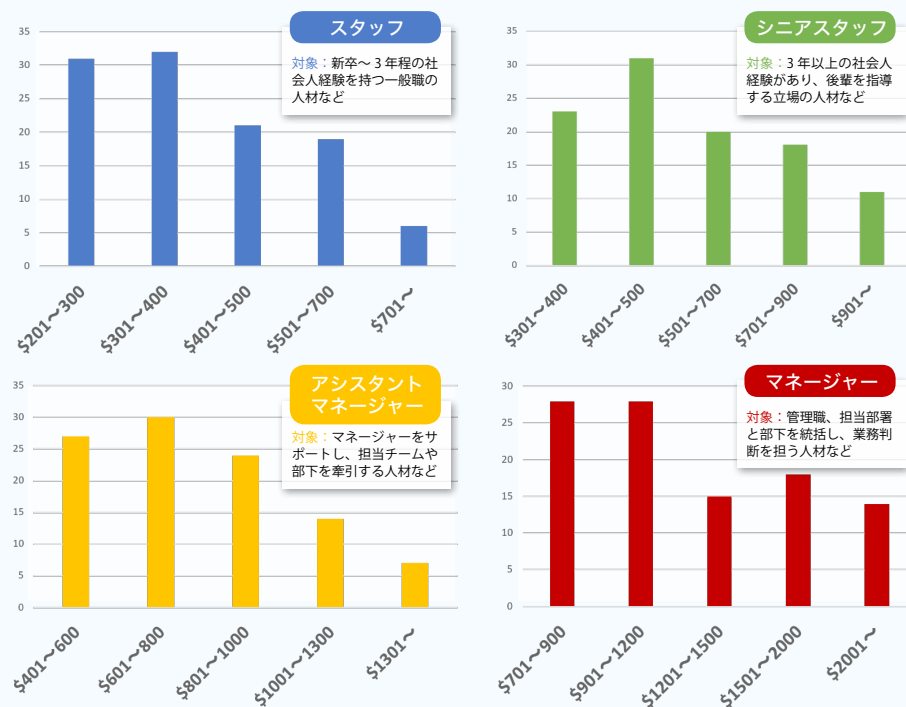
【2020 年度】日系企業 最新給与と動向

企業の事業展開や事情に合わせて、採用の多様化が進んでいる中で、求める人材のレベルや給与感を理解しながら、必要な人材を採用していくことが、今後必要になってくるだろう。既に日本人の給与を超えるような優秀な人材がいることなどを念頭に置き、ミャンマー人材の考え方も幅広く、今後の給与情報等を含めた人事面の把握も、重要である。