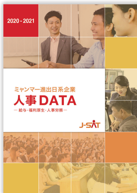
ミャンマー人材と人事のリアルなデータを盛り込んだ、冊子の表紙。現場で役立つ情報が詰まっている。

この度 J-SAT にてミャンマー人材業界では初となる、2020-2021年度版ミャンマー進出日系企業向けの人事データをリリースすることになった。初版になる本冊子は、現在の日系商工会登録社数を考えると3分の1以上となる165社の日系企業の回答を用いた生データから作成しており、昇給・給料・福利厚生・人事労務に関するアンケート調査結果はもちろん、長年収集していた人事データをもとに動向変化を分析しているため、単一的な人事データではなくミャンマーで人材動向を認識する上で不可欠な内容となっている。