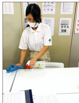
上：ノエポーさんの実習先での様子。 左：入賞した作文(全文は5ページからご覧ください)。

J-SAT が運営する日本語学校(J-SAT アカデミー)の卒業生の作品が、国際人材協力機構(JITCO)が主催する「第28回外国人技能実習生・研修生日本語作文コンクール」にて、全国2,971編の中から佳作で入賞した。