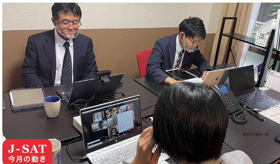
販売中の書籍一覧